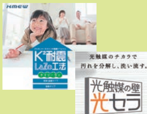
ケイミュー株式会社 建材メーカー：外壁材、屋根材、雨とい など