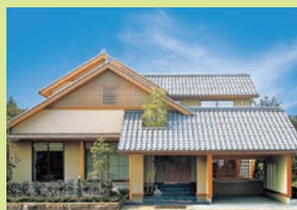
愛知県陶器瓦工業組合 瓦屋根の耐震工法の紹介/瓦の見本展示 など