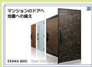
YKK AP株式会社 マンション用対震ドア改修工法紹介と展示など